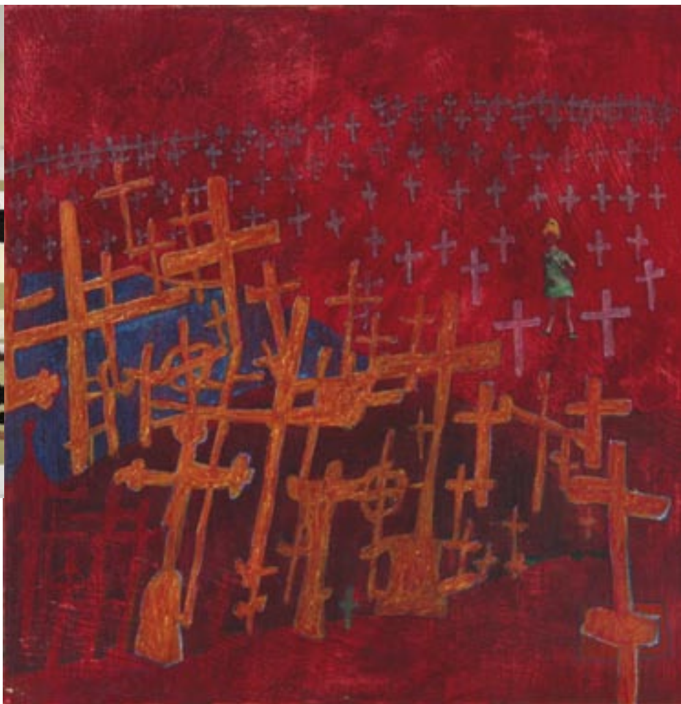
SEIJA SAINIO Pyhiinvaeltaja sekatekniikka, 2011